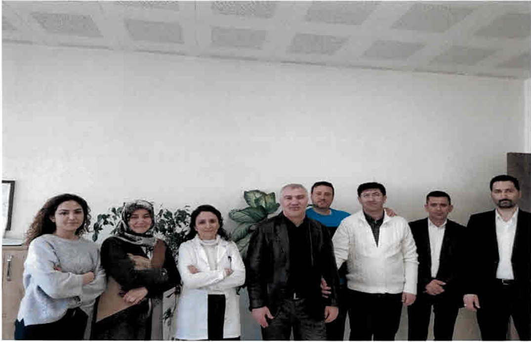
STRATEJİK PLAN ÜST KURULU

Durum analizinin ardından geleceğe yönelim bölümüne geçilerek okulumuzun amaç, hedef, gösterge ve eylemleri belirlenmiştir. Çalışmaları yürüten ekip ve kurul bilgileri altta verilmiştir.